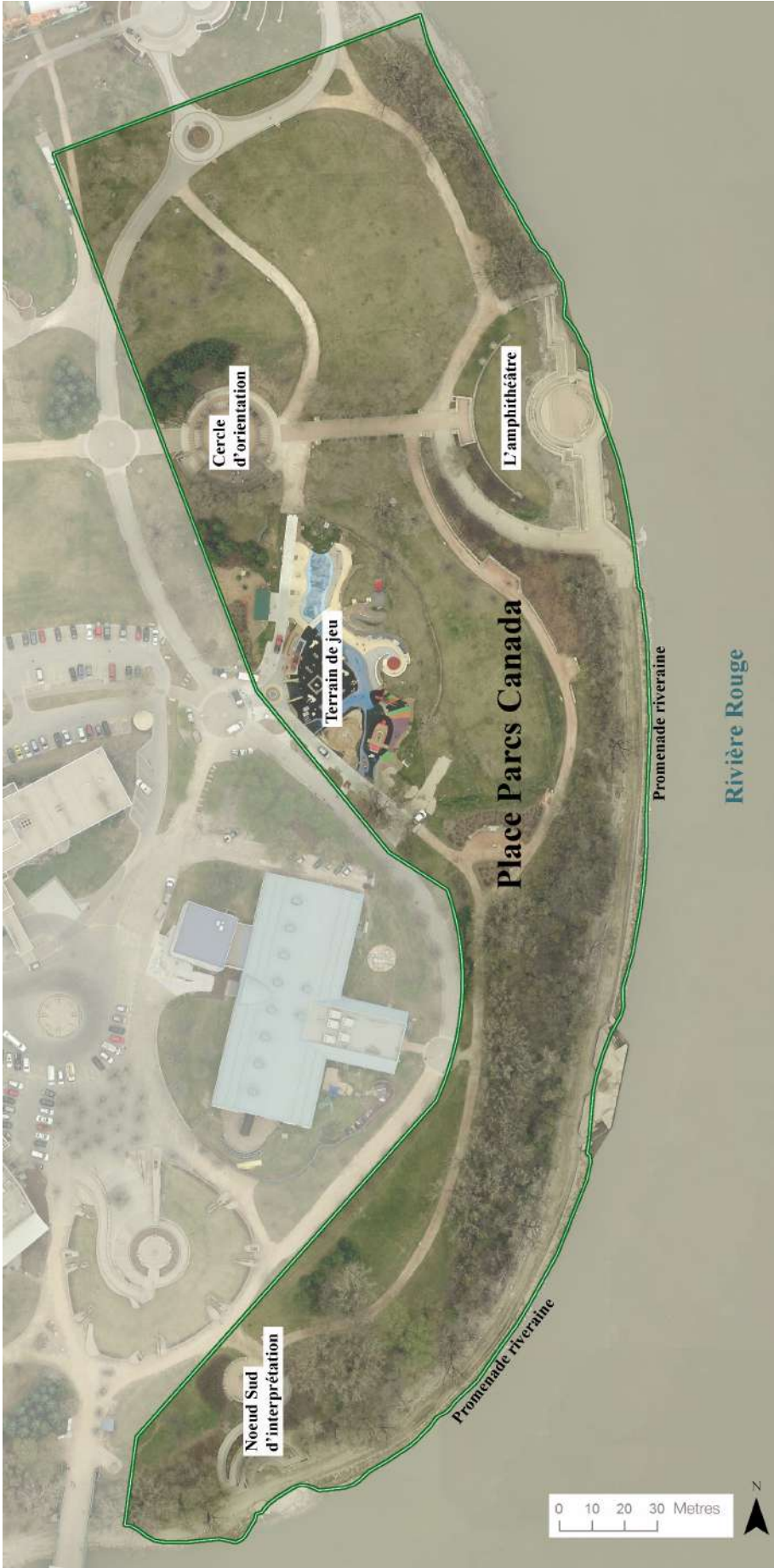
Figure 2 – Installations de Place Parcs Canada au lieu historique national de La Fourche. Parcs Canada, 2017.