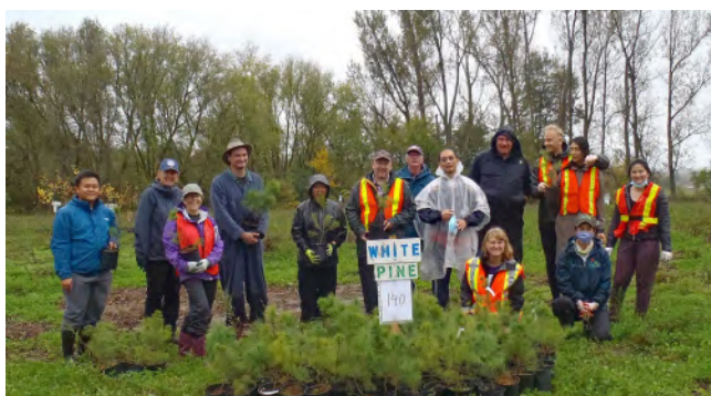
PC : Gary James