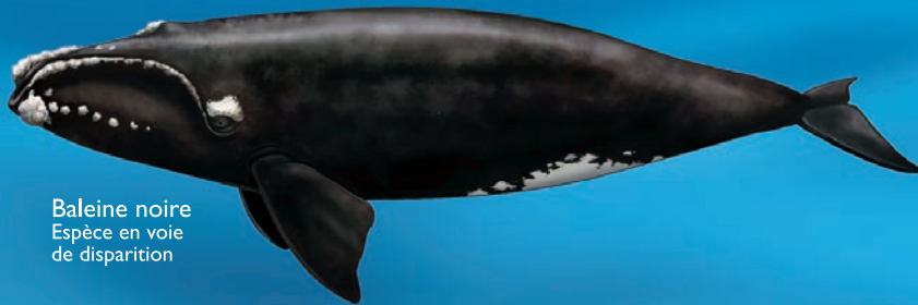
Baleine noire Espèce en voie de disparition