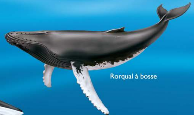
Rorqual à bosse