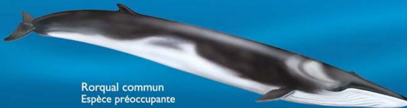
Rorqual commun Espèce préoccupante