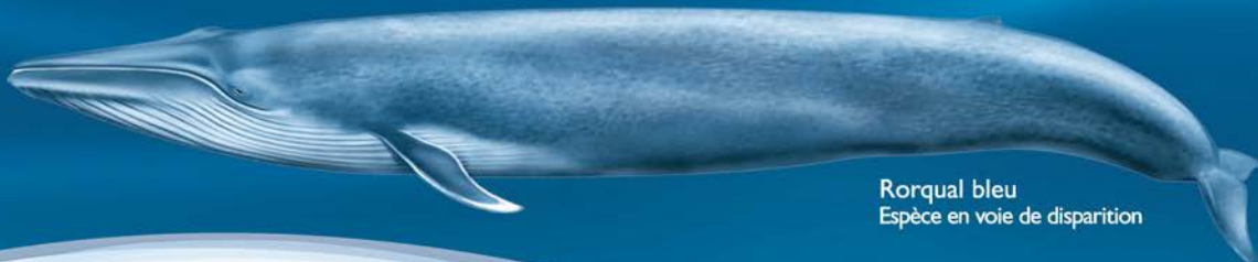
Rorqual bleu Espèce en voie de disparition